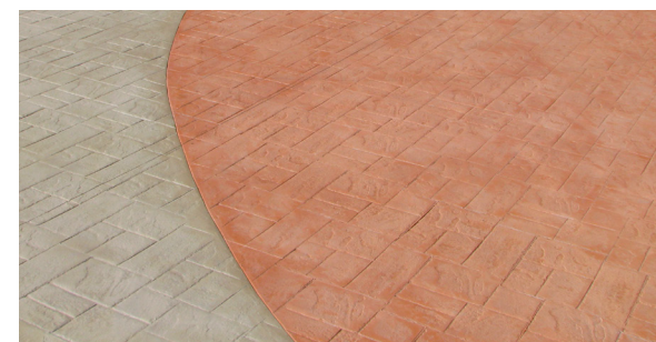
Detalhe do Sistema STAMPED SELECT